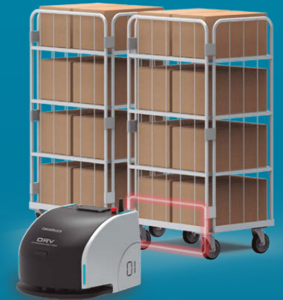
後方のカメラでカゴ車を認識し、把持します。