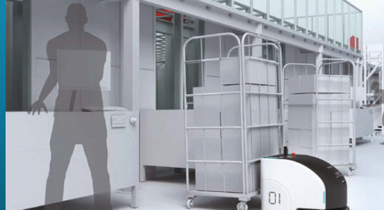
ピッキングステーションからの搬送