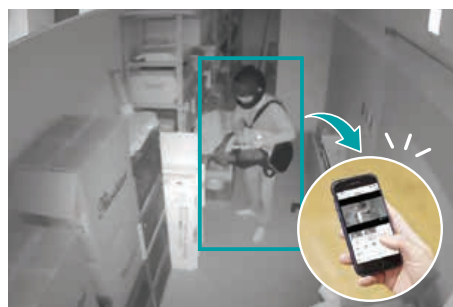
防犯に最適な「人検知」

Safie のクラウド録画サービスは、店舗運営のお 客様にうれしい機能が満載。レコーダー不要で、 PCとスマホでいつでもどこでも視聴可能な上、 音声通話もできるように。拠点間のコミュニケー ションも円滑になります。