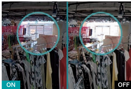
WDR (ワイド・ダイナミック・レンジ)

HD画質・30fpsのこれまでの高品質はそのまま、 WDRとナイトビジョンの性能を向上。陰や逆光、 照明が暗いシーンでも鮮明に録画でき、映像には 残っていても判別できなかったという事も無くなり ます。より使いやすい防犯カメラに進化しました。