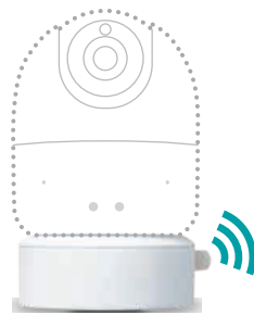
オプション LTEドック