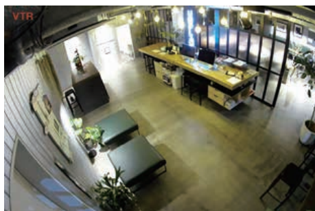
夜間やスタッフ不在時の防犯に

基本の防犯や店舗管理に加え、店舗のマーケティングや遠隔接客など、幅広い目的で利用できます。