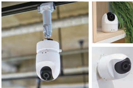
多彩なアダプタに対応