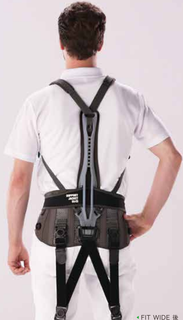
◀ FIT WIDE 後