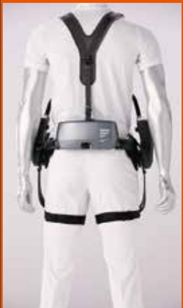
動力タイプのアシストスーツを 手軽に