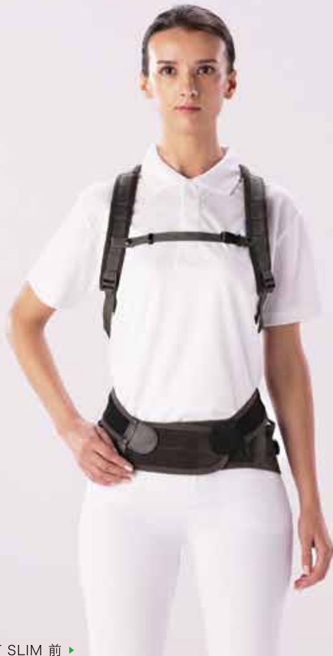
FIT SLIM 前 ▶

メーカー希望小売価格 SLIM 29,000円(税込31,900円) WIDE 32,000円(税込35,200円)