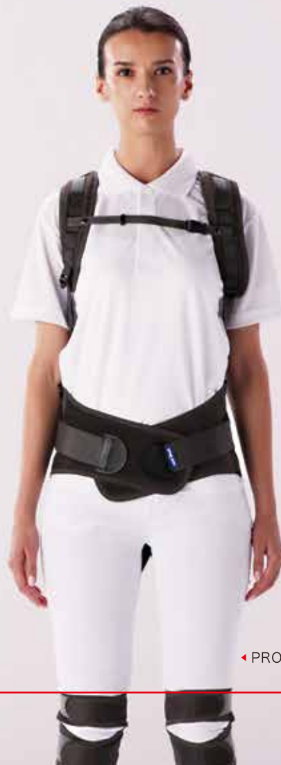
◀ PRO II 前