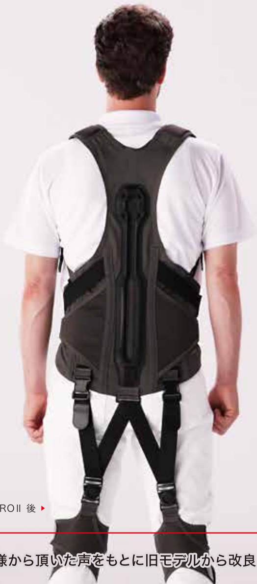
PRO II 後 ▶