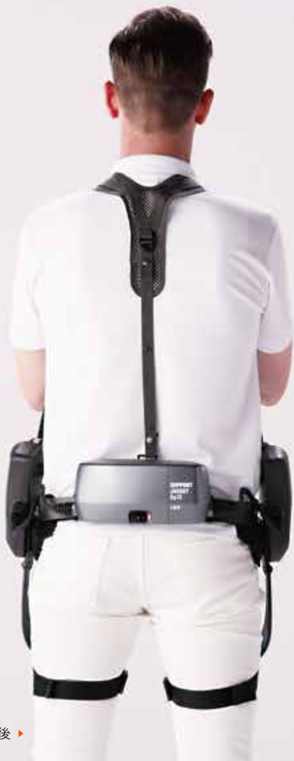
ROBO 後 ▶