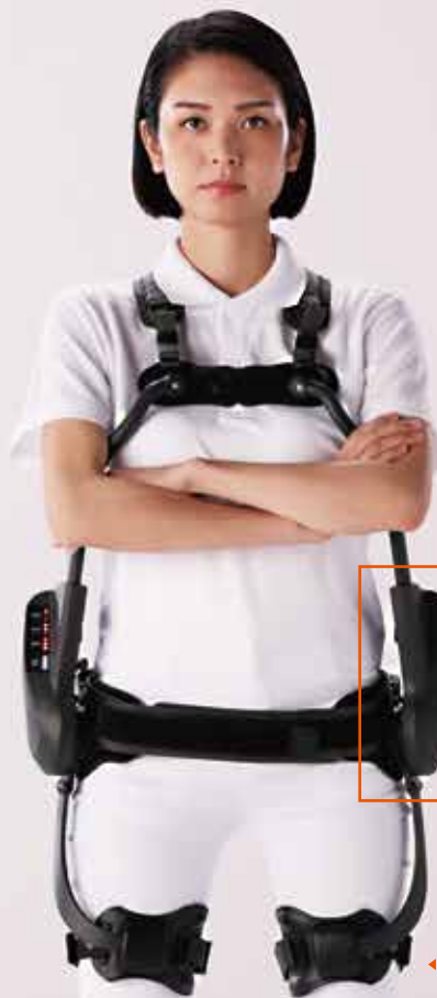
◀ ROBO 前